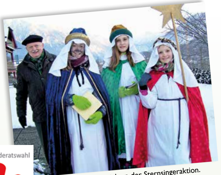
Firmlinge beteiligen sich an der Sternsingeraktion. Gemeinsame Hilfe für Projekte in Afrika, Lateinamerika und Asien