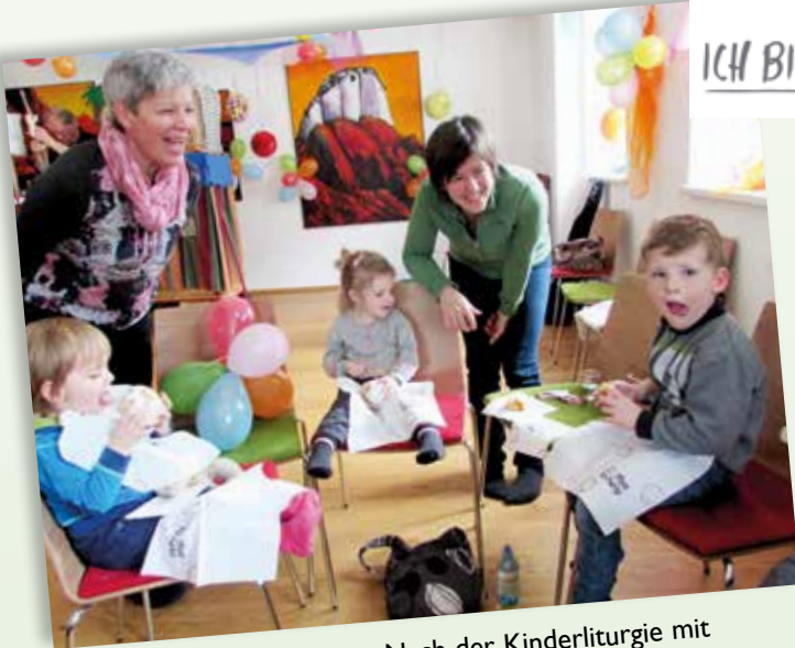
Schleckermäuler – Nach der Kinderliturgie mit Kasperltheater gibt es im Fasching leckere Krapfen.