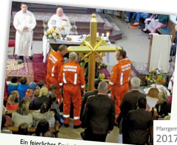
Ein feierliches Ereignis mit großer Beteiligung der Bevölkerung – die Turmkreuzsteckung im Herbst 2016